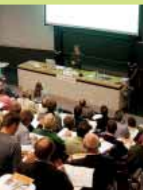
Cette année, les résultats du projet FAWA étaient le thème central du Symposium de Berthoud sur les pompes à chaleur.

d'essai WPZ de Buchs et les enseignements à tirer du projet FAWA à propos du montage des équipements et de l'information de la clientèle. Les nombreux participants à la manifestation ont eu l'occasion de prendre part aux débats relatifs à d'autres aspects importants de l'utilisation des pompes à chaleur.